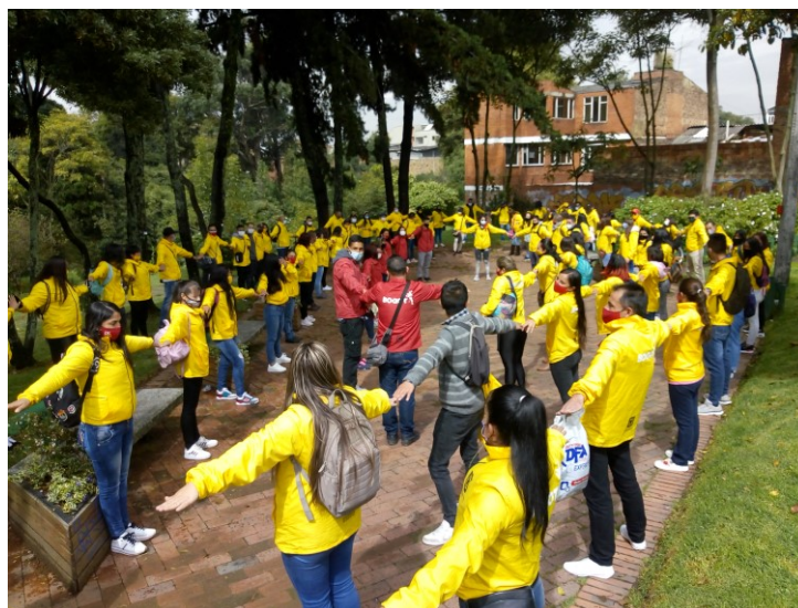
Los 80 Vigías Ambientales, Gestores de Ambiente, y servidores Institucionales 22 de marzo de 2021.

Al igual que desde el año 2010, y con un total compromiso de los Corporados, se realizó la “Celebración del Día del Agua - Canto al Agua” , como parte de la Gestión Educativa. Se contó con la participación de más 100 personas en la Plazoleta Corvif. Mayoritariamente, estuvieron los Vigías Ambientales Locales y Gestores Ambientales.